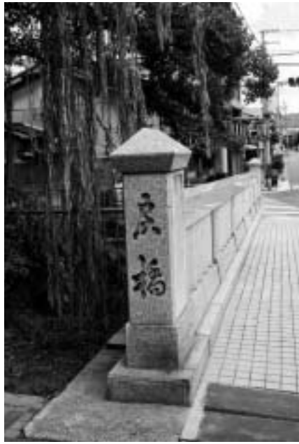
左・京都の大殉教 中・一条炭橋 右・元和キリシタン殉教地石碑