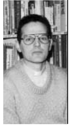
取材協力 レンソ・デ・ルカ神父 (イエズス会)

ゆったりとした流れの中で歴史を刻んでいく京都の鴨川、都の中心を流れるこの川で殉教の血が流されたことを誰が想像できるでしょうか。清らかに、時には朗々と流れていきます。江戸時代初期の日本の三大殉教と言え、長崎、江戸、そして京都。1622年の長崎、1623年の江戸に比べ、京都の殉教は女性や子どもが数多く含まれているのが特徴です。